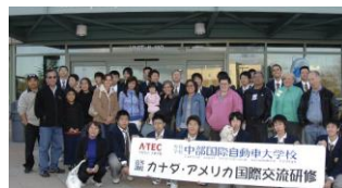
海外研修にてホストファミリーと一緒に (カナダ バンクーバー)