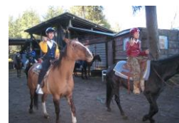
乗馬トレッキング (カナダ スコーミッシュ)