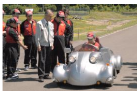
北海道研修 テストコースにて体験試乗